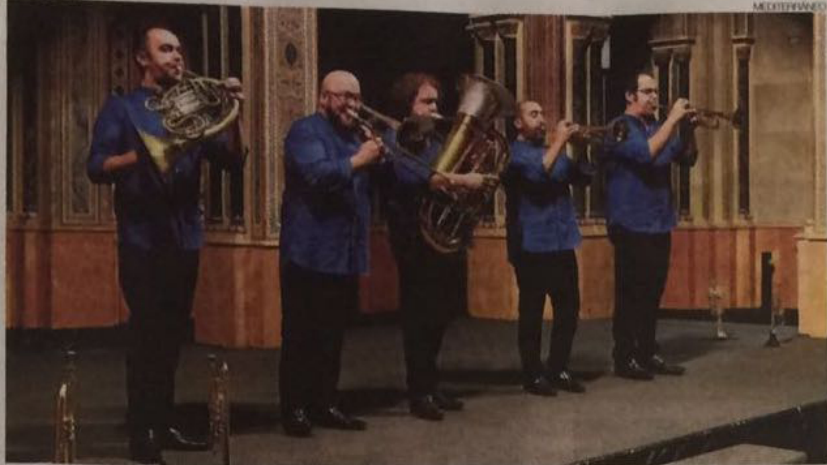
►► La banda metálica Spanish Brass Luur Metals será la primera actuación de esta edición del festival.